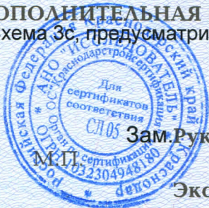
Схема 3с, предусматривающая проведение инспекционного контроля не реже одного раза в год.